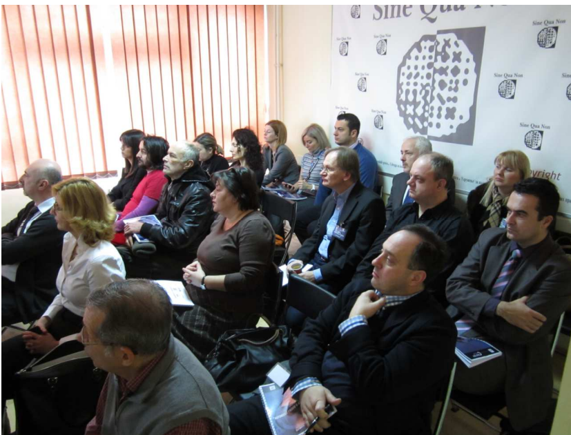
Radni dio okruglog stola